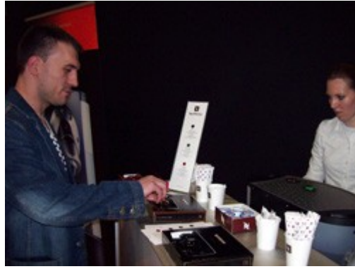
La degustación de café pone el punto final