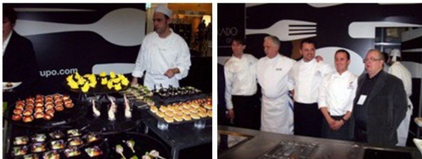
Espacio Bokado. A la derecha, Arzak con parte del equipo

verduras, el IX Rincón del vino, el IX Rincón del Pan, del café, el VIII Rincón de la cerveza, el XVI Concurso de Cortadores de jamón, el II concurso de abre ostras así como también el espacio del FROM.