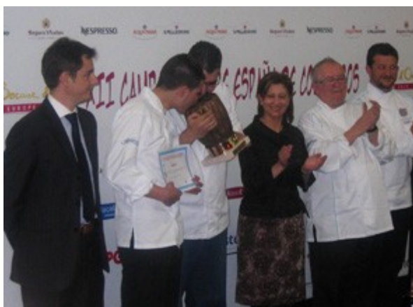
Los finalistas del campeonato de cocineros, junto a miembros del jurado y la organización

La mañana del miércoles resultó bastante interesante por darse a conocer, entre otros, a los finalistas del XII Campeonato de España de jóvenes cocineros y restauradores, que fueron: