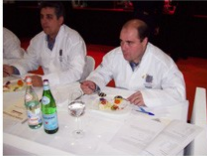
Jurado del concurso de cocineros. Arzak presidió la mesa.