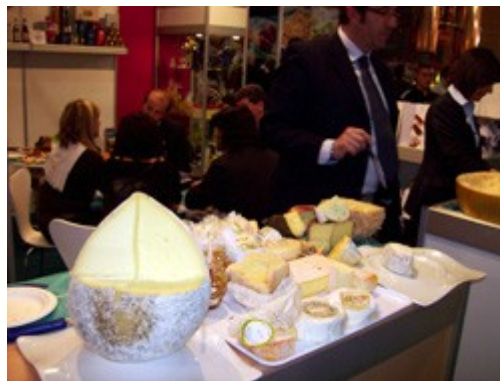
Stand de quesos