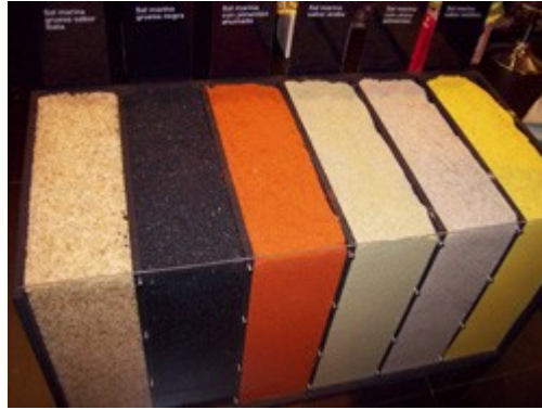
Espacio dedicado a la sal

Finalmente, la mañana del jueves, pudimos asistir a exposiciones de nuevos productos, presentaciones de productos con denominación de origen y ecológicos, degustación de conservas, aceites..., y un largo etcétera de nuevos productos.