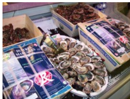
Stand de ostras