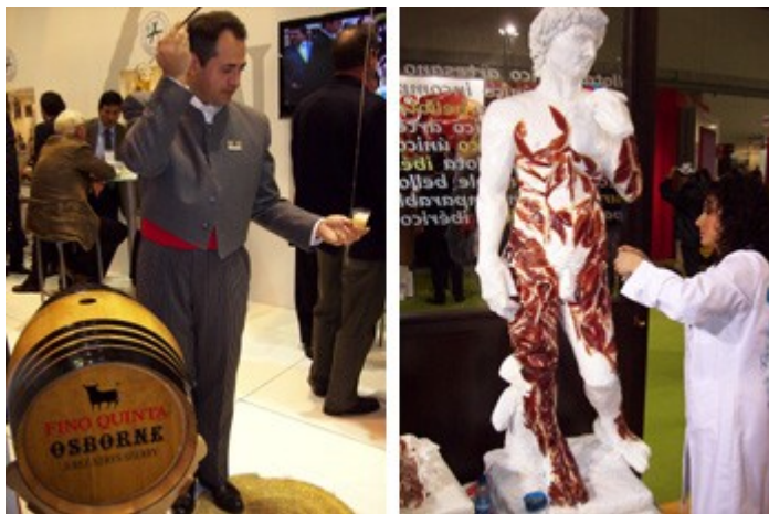
Los espacios del vino de Jerez y del jamón