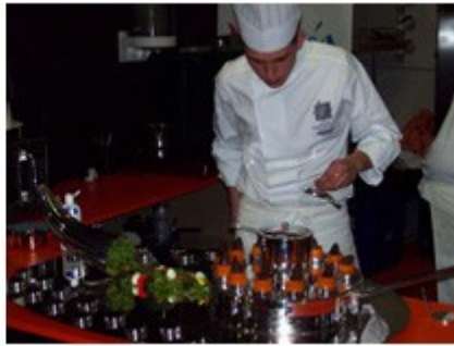
Cocineros participando en el Campeonato de Jóvenes Cocineros