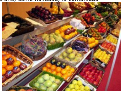
Túnel de frutas y verduras

as, exhibiciones como el VIII Túnel del queso, el I Túnel de frutas y