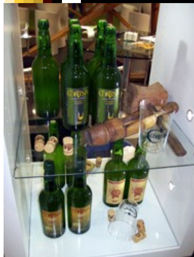
Stand dedicado a la sidra asturiana

los mejores productos de cada zona. Este año, como novedad, la comunidad autónoma invitada al Taller de los Ser degustar una larga lista de productos muestra en la imagen. Dicho taller, que enfocado para que el visitante se familiarice con la gastronomía.