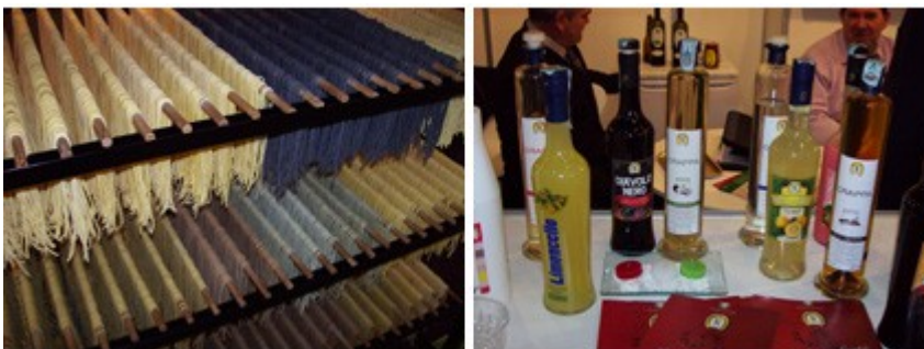
Diferentes tipos de pasta y licores italianos